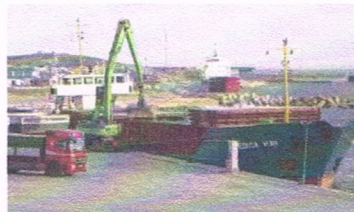
Stor coaster lossers ved Hvide Sande Havn.